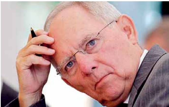
Finanzminister Wolfgang Schäuble sieht in einer Finanzunion die Lösung der Probleme.

Im Land Brandenburg sorgen sich auch Beamte und Ruheständler . Dieses Bundesland hat rund 2 Millionen Euro aus seiner Pensionskasse für „Staatsdie-