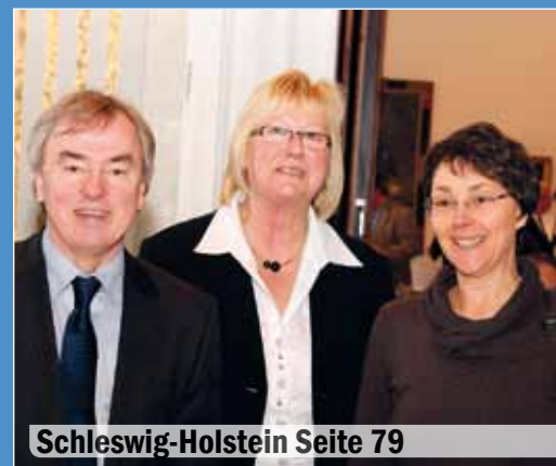
Schleswig-Holstein Seite 79