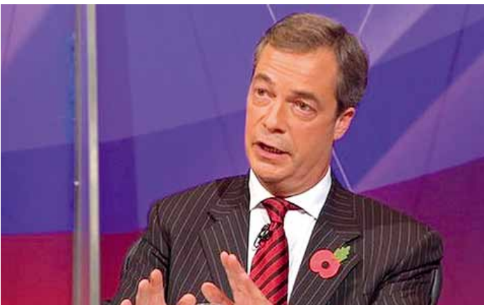
EU-Abgeordneter Nigel Farage warnt seine in Spanien lebenden Landsleute vor der Haftung für spanische Banken.

pier, das bereits am 10. Dezember 2012 vorgelegt wurde. Es belegt, dass auch die amerikanischen und britischen Behörden, genau wie die Behörden in der EU , die privaten Bankguthaben „plündern“ wollen. So behandelt das Papier die Kundenguthaben in den Banken als