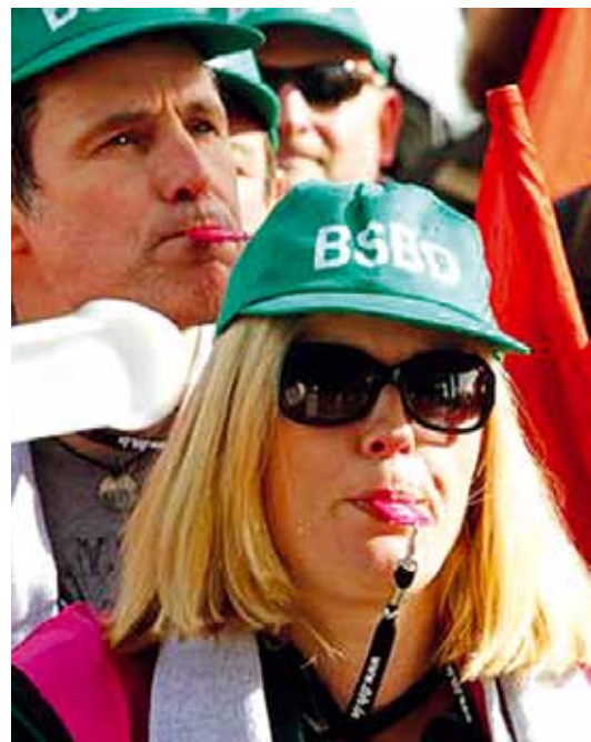
Gewerkschafter des Bundes der Strafvollzugsbediensteten Deutschlands demonstrieren in Düsseldorf.