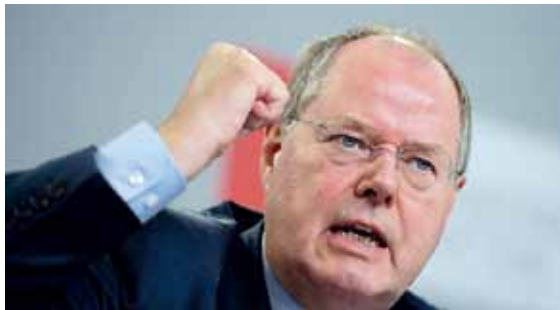
Nach holprigem Start droht dem Bundestagswahlkampf von Peer Steinbrück (SPD) jetzt Gefahr aus Nordrhein-Westfalen. Die Beamten sind „auf der Palme“.

Ein anderer Kollege schreibt: „Mit Ihrer Entscheidung der ‚Gleichbehandlung im Unrecht‘ haben Sie meiner 3-köpfigen Familie die Entscheidung für die nächsten Wahlen dauerhaft abgenommen.“ Ein Schreiber setzt sich mit der kommenden Bundestagswahl auseinander