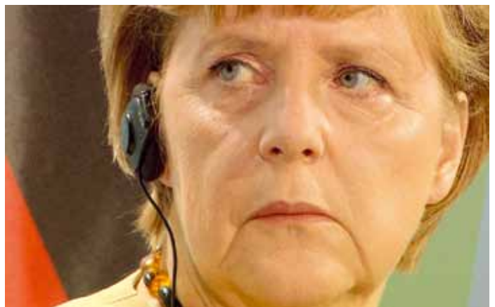
Bundeskanzlerin Angela Merkel verlangt Reformen für deutsches Geld, damit die Finanzkrise nicht zu einem Fass ohne Boden wird.

Das Ziehen der „nationalen Karte“ durch die Bundeskanzlerin hat sich so manch mündiger Bundesbürger bei anderen Anlässen sicherlich schon des Öfteren gewünscht. Hier aber verkannte die Regierungschefin, dass zumindest ein Teil der Deutschen sehr wohl begriffen hat, dass mit derartigen Rettungsaktionen in erster Linie die Banken und die Finanzindustrie schadlos gehalten werden sollen .