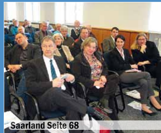
Saarland Seite 68