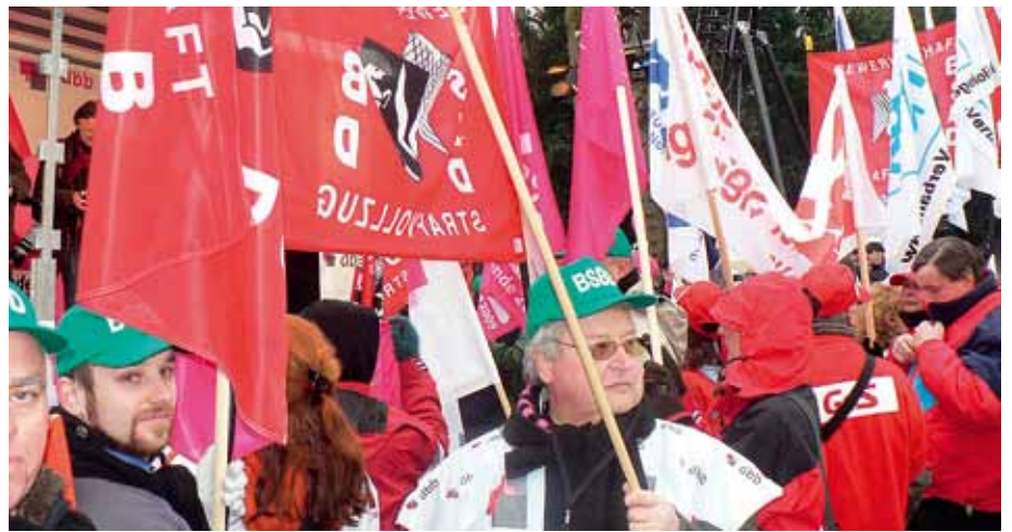
Um berechnete Ansprüche realisieren zu können, dürfte auch in diesem Fall Präsenz auf der Straße erforderlich sein.

und schreibt: „Sehr geehrte Frau Kraft , Sie haben sich, Herrn Steinbrück und der SPD mit dieser Entscheidung keinen Gefallen getan. Sie werden die Hauptverantwortung für die absehbare Niederlage bei der Bundestagswahl und der nächsten Landtagswahl übernehmen müssen. Denn eines sollten Sie merken: Beamte verzeihen, vergessen aber nicht!“