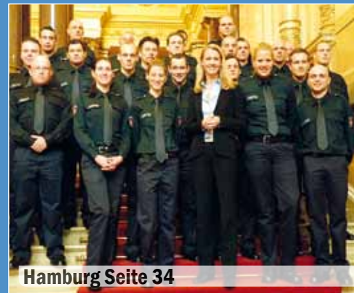
Hamburg Seite 34