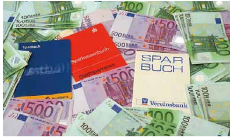
In Zypern werden die Sparer an den Kosten zur Rettung des Landes beteiligt.

oben geben “. Immerhin habe Brandenburg ja auch in irische Papiere investiert, die sich prächtig erholt hätten. Das sich Brandenburgs „Pensionsjongleure“ praktisch „auf den letzten Drücker“ u. a. ihrer Anlagen in von der Wirtschaftskrise besonders betroffenen Ländern wie z. B. Portugal, Spanien und Frankreich zu entledigen vermochten, führt der Minister nicht weiter aus. Auch wenn diese Art von märkischer Geldanlage anfänglich von Erfolg gekrönt war, bleibt festzuhalten, dass, abgesehen von den dieser Vorgehensweise innewohnenden Risiken für künftige Ruhestandsbeamte, das Finanzministerium nicht gerade viel Vertrauen in die Möglichkeiten des eigenen Landes hegt.