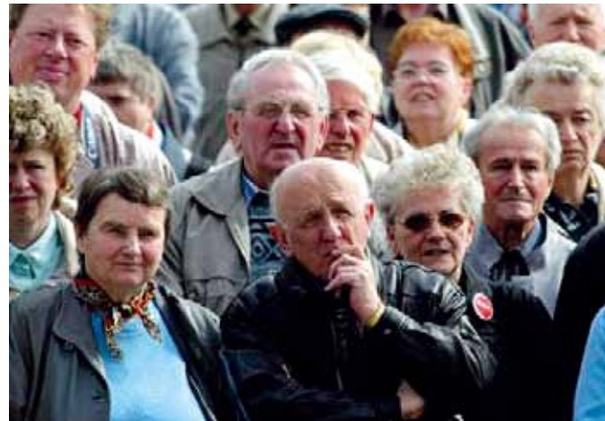
Das Land Brandenburg spekuliert mit den Rücklagen für seine Pensionäre.

dergelassen haben. Er empfiehlt ihnen: „ Holt Euer Geld da raus, solange Ihr noch die Chance dazu habt “. Weiter wird Farage in „ Goldreport “ vom 26. März 2013 wie folgt zitiert: „Die EU bemächtigt sich nun aller Möglichkeiten, um