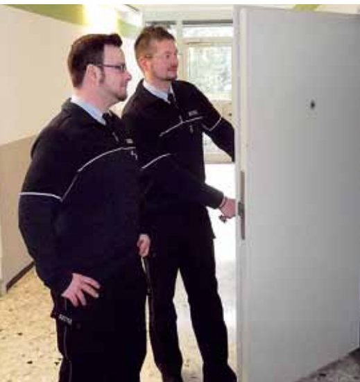
Die Kolleginnen und Kollegen der Laufbahn des allgemeinen Vollzugsdienstes schieben annähernd eine halbe Million Mehrarbeitsstunden vor sich her.

ser ihre Überlastungssituation erkennt und für die dringend gebotene Abhilfe sorgt. In Kürze beginnen wieder die Urlaubsmonate. In dieser Zeit ist die Lage besonders schlimm, weil die Urlaubsgewährung den Freizeitausgleich für geleistete Mehrarbeit nahezu vollständig verhindert.