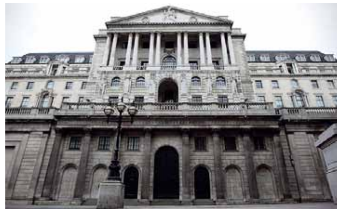
Die Bank of England befürchtet, die Politik könnte versucht sein, die Staatsschulden „wegzuinflationieren“.