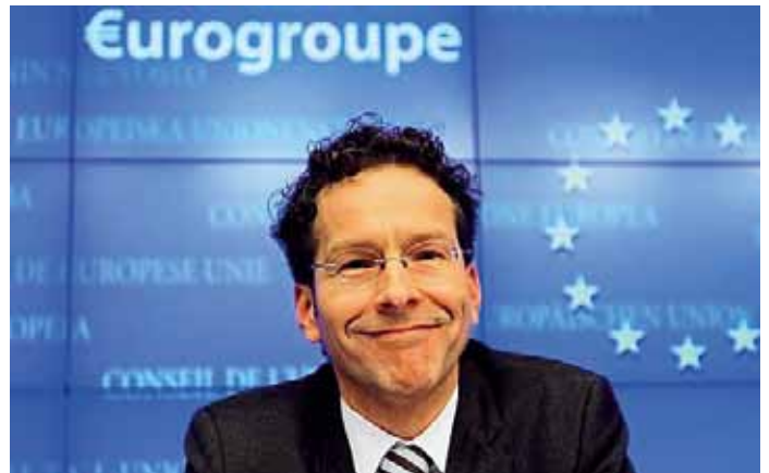
Jeroen Dijsselbloem sah zunächst die Zypern-Rettung als Modell für die Zukunft an.

„ Vom Freitagabend bis Montag soll in Zukunft das ganze abgeschlossen sein und im Idealfall merken es die Kontoinhaber gar nicht. Sie würden dann nur am Montagmorgen sehen, dass ihr Konto belastet wurde. So kann man verhindern, dass ein Banken-Run einsetzt und dass Banken vorübergehend geschlossen werden. Im Laufe dieses Jahres ist mit einer entsprechenden