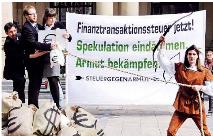
Wenn das Geld zur Ware wird, leiden die abhängig Beschäftigten und profitieren die Spekulanten.

Das sind aber mehr oder weniger wohl nur Lippenbekenntnisse, die nach den Ereignissen in Zypern in einem neuen Licht gesehen werden müssen. Das, was man sonst nur in korrupten, diktatorischen Regimes glaubt feststellen zu