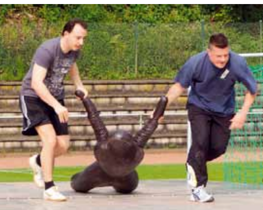
Einen leblosen Körper zu transportieren, ist ein schweißtreibendes Geschäft.

Die Anwärterinnen und Anwärter wie auch das Lehrpersonal äußerten sich rundum zufrieden über den gesamten Ablauf der Veranstaltung. Sie war ein voller Erfolg und sollte zum festen Bestandteil des Schulangebotes werden. Die Siegerehrung fand am 13. Juni 2013 in einem feierlichen Rahmen in der Schulaula statt. Nach einer kurzen Ansprache des Schulleiters wurden den drei besten Ausbildungsgruppen unter großem Beifall die Siegerpokale und Medaillen