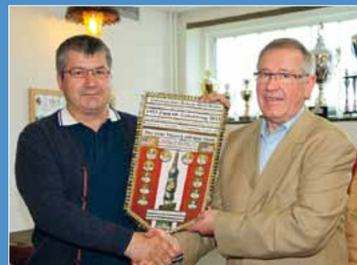
Saarland Seite 81