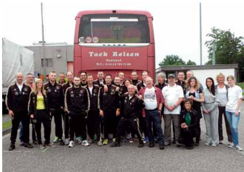
Die Vorfreude ist den Kolleginnen und Kollegen anzusehen: Burgund wartet.

Die gute Stimmung sollte sich auch am folgenden Tag fortsetzen, als das gesamte Team aus Geldern in das Turniergehen eingriff. Es lief in Trikots der deutschen Fußball-Nationalmannschaft auf. Dass dies möglich war, dafür gebührt der Sepp-Herberger-Stiftung ein herzliches Dankeschön. Die Stiftung hatte die Mannschaft mit Trikots, Trainingsanzügen und Regenjacken des DFB ausgestattet. Besonderen Dank hat das Team auch der Firma Derbystar aus Goch abzustatten, die das Team mit Bällen und sonstigem Mannschaftsbedarf versorgte.