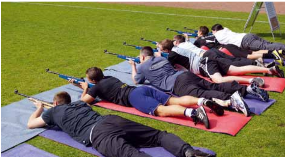
Auch das Lasergewehr stellt hohe Anforderungen an die Geschicklichkeit des Schützen.

Im Rahmen der theoretischen Ausbildung an der Justizvollzugsschule des Landes NRW in Wuppertal fand am 11. Juni 2013 erstmalig ein Leistungswettbewerb für die Nachwuchskräfte der Laufbahnen allgemeinen Vollzugsdienstes und Werkdienstes mit Simulationen von außergewöhnlichen Sicherheitsstörungen im beruflichen Arbeitsalltag statt. Die Durchführung aller Stationen erfolgte auf einer nahegelegenen Sportanlage in Wuppertal „Am gelben Sprung“ in der Winchenstraße 41.