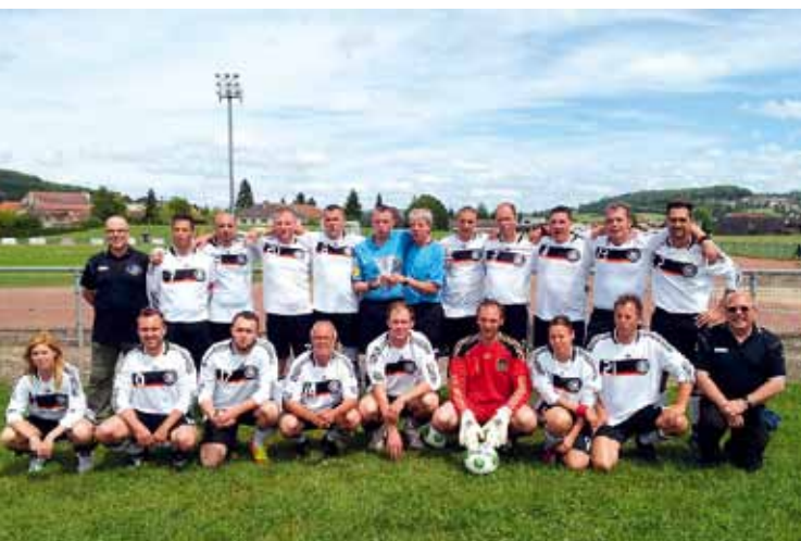
Auch wenn das ein oder andere Trikot etwas spannte, hinterließ das Gelderner Team in der Spielkleidung der Nationalmannschaft doch einen positiven Eindruck.