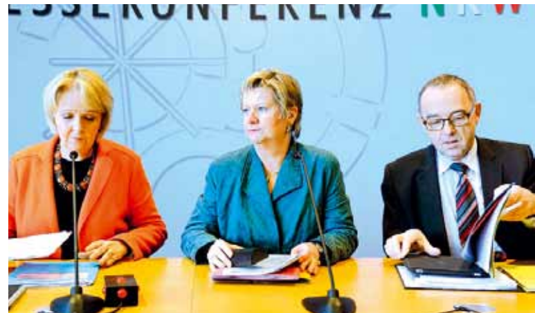
Ministerpräsidentin Hannelore Kraft (SPD), ihre „Vize“ Sylvia Löhrmann (Grüne) und Norbert Walter-Borjans (SPD) erklären vor der Landespresskonferenz, weshalb für die Beamten kein Geld mehr im Staatsäckel ist.