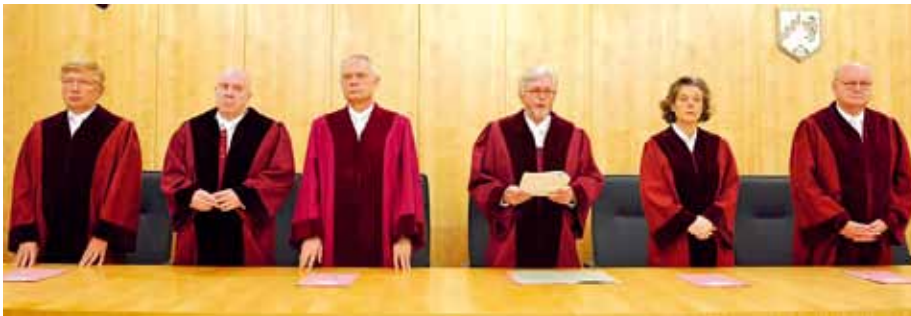
Die NRW-Verfassungsrichter haben jetzt über das Besoldungs- und Versorgungsanpassungsgesetz der Landesregierung zu entscheiden.

D ie Abgeordneten der Opposition haben ihre Ankündigung wahr gemacht. Sie lassen die Verfassungsmäßigkeit des rot-grünen Gesetzes zur Anpassung der Dienst- und Versorgungsbezüge durch den Verfassungsgerichtshof in Münster überprüfen. Die Fraktionen von CDU und FDP sowie zwei Abgeordnete der Piraten haben diese Überprüfung beantragt. Sie haben gute Chancen, dass das Gericht die Verfassungswidrigkeit dieses Gesetzes feststellt. Möglich ist die verfassungsrechtliche Überprüfung eines Gesetzes, wenn mehr als ein Drittel der Abgeordneten einen entsprechenden Antrag an den Verfassungsgerichtshof richtet.