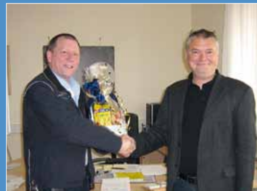
Rheinland-Pfalz Seite 75