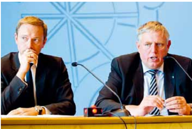
Christian Lindner von der FDP und CDU-Fraktionsvorsitzender Karl-Josef Laumann erläutern, weshalb sie Verfassungsklage gegen das Gesetz zur Anpassung von Besoldung und Versorgung eingereicht haben.

Die beiden Vertreter der Opposition im nordrhein-westfälischen Landtag rechnen im ersten Halbjahr 2014 mit einer Entscheidung des Gerichts. Finanzminister Norbert Walter-Borjans (SPD) gab sich hingegen optimistisch und wies alle Vorwürfe gegen das Besoldungs- und Versorgungsanpassungsgesetz zurück. Er machte erneut darauf aufmerksam, dass die vollständige Übertragung des Tarifergebnisses zu Mehrausgaben von 710 Millionen Euro geführt hätte. Dies könne sich das Land einfach nicht leisten, eine solche Entscheidung sei folglich nicht zu verantworten gewesen. Gegen das Vor-