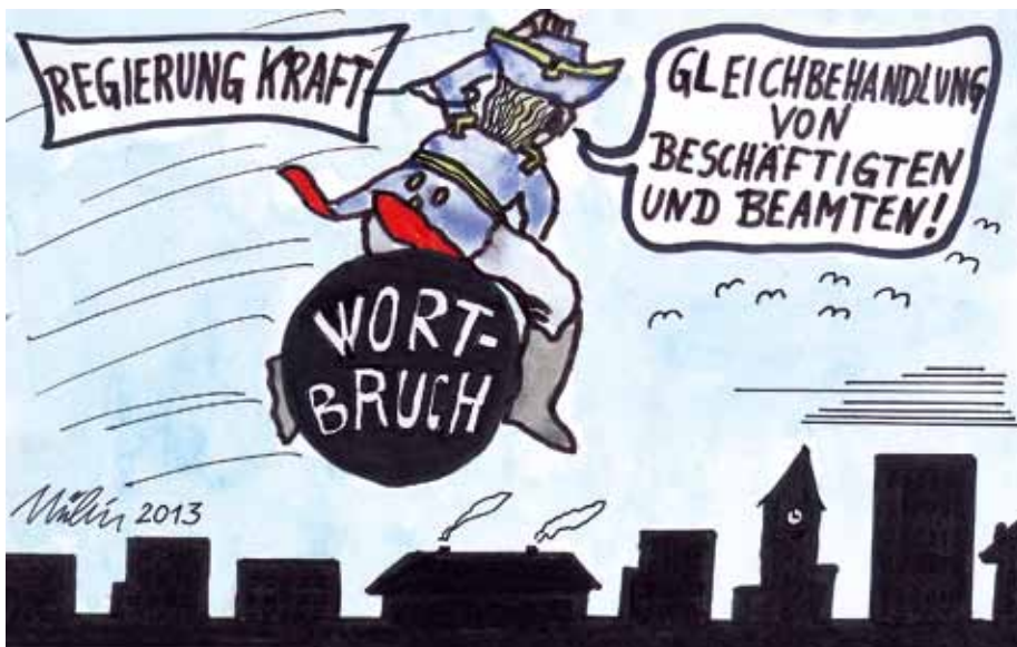
Beamte, die auf die Landesregierung vertraut hatten, waren hinsichtlich der Anpassung ihrer Bezüge rettungslos verlassen.

kleinere Übel entschieden. Indem sie 710 Millionen Euro bei den Beamten und Pensionären spare, habe sich die Regierung Kraft trotz der Schuldenbremse politische Handlungsspielräume erhalten und eröffnet.