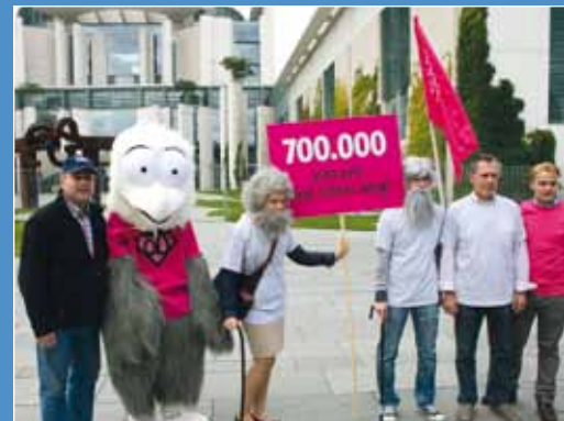
Berlin Seite 30

Fachteil: Urteil Urlaubsabgeltungsanspruch