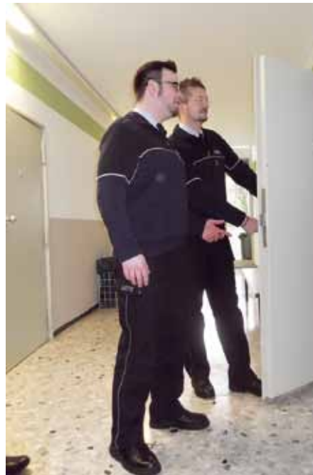
Die erweiterte Sicherheitsüberprüfung der Bediensteten des Strafvollzuges wirft Probleme auf.

Wenn der Strafvollzug nunmehr einen solch hohen Aufwand bei der Sicherheitsüberprüfung betreiben muss, dann wird sich die Besetzung freier oder frei werdender Stellen deutlich verzögern, und zwar mit allen negativen Folgen für das