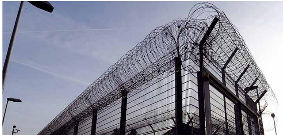
Der privatisierte Strafvollzug ist kein Sparmodell.

Der amerikanische Generalstaatsanwalt hat offensichtlich begriffen, dass das Wegsperrern von Menschen nicht zum erhofften Erfolg führt, sondern lediglich die Taschen der privaten Gefängnisbetreiber füllt. Deshalb hat Eric Holder ein Umdenken in der Kriminalpolitik angekündigt. Er will künftig zielgerichtete Maßnahmen ergreifen, von denen ein Rückgang der Gefangenenzahlen erwartet werden darf. Gefängnispopulation führen werden. Der Kongress soll mit zahlreichen Gesetzesreformen dem US-amerikanischen Strafrechtssystem eine neue Wendung geben, die vorrangig auf die Besserung des Täters abstellt. Solche Schritte und Ankündigungen werden von der privaten Gefängnisindustrie als existentielle Bedrohung erlebt und wahrgenommen. Da ist es nur konsequent, wenn sie sich auf weltweite Expansion einstellt, um die in Amerika zu erwartenden Gewinneinbrüche andernorts kompensieren zu können.