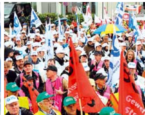
Die Beamten und Versorgungsempfänger haben der Regierung Kraft bei der Bundestagswahl 2013 massiv das Vertrauen entzogen.