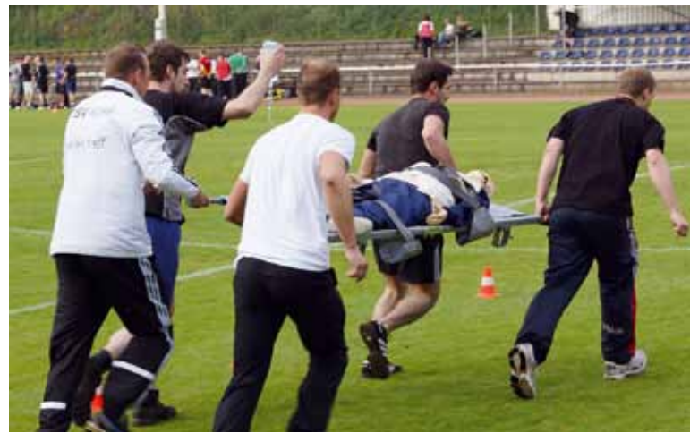
Wenn der Verletzte fixiert ist, kommt es neben der Aufrechterhaltung der Versorgung auch auf Schnelligkeit an.