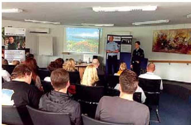
Neue Wege im Kampf um geeignete Nachwuchskräfte beschritten.

Etliche der Anwesenden nutzten die Gelegenheit, um ihre Bewerbungen sofort an die beiden Referenten zu übergeben. Der Arbeitgeberservice des Jobcenters bietet regelmäßig interessierten