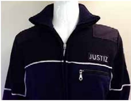
So könnte die Strickjacke aussehen.

und Kollegen stets fragend angesehen, wenn Dritte den Blick auf die Schlaufen des Hemdes richten.