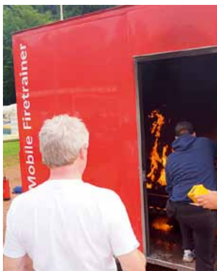
Das Löschen eines Brandes verlangt spezifisches Wissen.

Veranstaltung war ein Staffellauf über jeweils 400 Meter, an dem auch die Lehrkräfte teilnahmen. Gegen 16:30 Uhr war der Wettbewerb beendet.