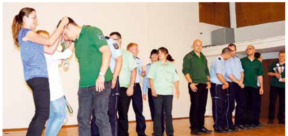
Wie bei fast allem steht der Lohn am Ende der Anstrengungen.

238 Anwärterinnen und Anwärter des allgemeinen Vollzugsdienstes und des Werkdienstes nahmen in 14 Ausbildungsgruppen am Leistungswettbewerb teil. Nach einem reibungslosen Aufbau startete der Wettbewerb pünktlich nach der Begrüßung durch den Schulleiter um 8:30 Uhr. In einer kurzen Mittagspause gab es zur Stärkung ausschließlich Obst, Müsliriegel und Wasser, um die Fitness nicht negativ zu beeinflussen. Höhepunkt und gleichzeitiger Abschluss der