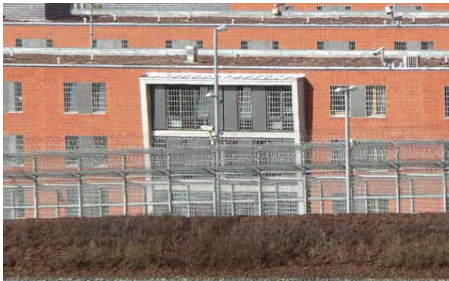
Die JVA Hünfeld ist ein Beispiel dafür, dass optimistische Planungen dauerhaft unerreichbar bleiben können.

Diesen Prinzipien gilt es auch dann treu zu bleiben, wenn in den nächsten Monaten und Jahren die Lobbyisten der Unternehmen der amerikanischen Gefängnisindustrie verstärkt versuchen werden, ihr Geschäftsmodell in Europa und damit auch in Deutschland durchzusetzen und zu etablieren. Die künftig einzuhaltende Schuldenbremse könnte ein Argument sein, sich solchen Angeboten des industriellen Gefängnis Komplexes zu öffnen. Hier wünschen wir den Verantwortlichen in Administration und Politik die notwendige Standfestigkeit, um finanzielle Risiken zu Lasten des Steuerzahlers abzuwehren.