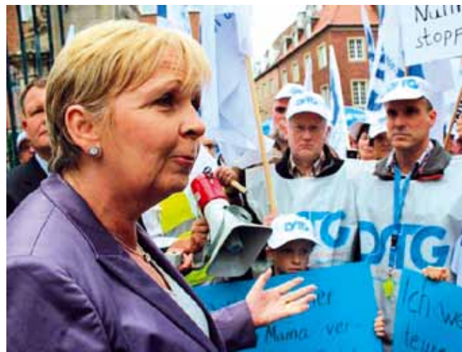
Ministerpräsidentin Hannelore Kraft (SPD) konnte in den vergangenen Monaten kaum einen offiziellen Termin wahrnehmen, ohne nicht gleich von wütenden Beamten umringt zu sein.

Für die Einlegung des Widerspruchs sind zwischenzeitlich Musterschreiben entwickelt worden. Mit dem Musterwiderspruch können die Rechtsansprüche bis zum rechtskräftigen Abschluss der Musterverfahren gewahrt werden. Das Musterschreiben enthält deshalb den Antrag, die Entscheidung über den Besoldungserhöhungsantrag bis zum Abschluss der Musterverfahren zurückzustellen und auf die Einrede der Verjährung zu verzichten.