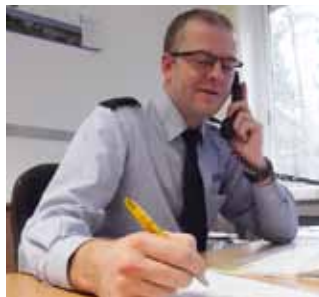
Für die Nachwuchskräfte im AVD und des Werkdienstes wird der Anwärtersonderzuschlag für ein weiteres Jahr gewährt.

lichen Erfolge nicht vom Himmel fielen. Hierfür bedürfe es einer starken gewerkschaftlichen Interessenvertretung, um die Belange der Berufsgruppenminderheiten des Strafvollzuges wirksam und erfolgreich zu vertreten.