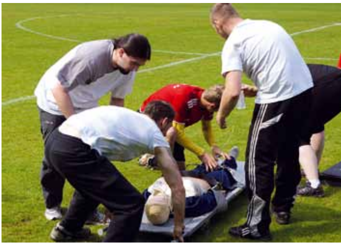
Erste Hilfe und Vorbereitung des Transports verlangen Wissen, Übersicht und Gelassenheit.