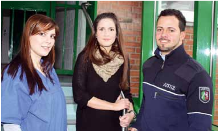
Der Anwärtersonderzuschlag ist zunächst bis Ende 2015 gesichert. Bewerbern soll damit ein finanziell einigermaßen auskömmliches berufliches Engagement im Strafvollzug ermöglicht werden.

Der Strafvollzug bemüht sich speziell um Zweitberufler, um deren berufliche Erfahrungen für ihre künftige Arbeit im Strafvollzug zu nutzen. Gerade auf diese Erfahrungen setzt der Strafvollzug bei der Wahrnehmung seines Behandlungsauftrages. Diese Personengruppe ist aber etwas älter als Schulabgänger und daher vielfach bereits in finanzielle Verpflichtungen eingebunden. Der Strafvollzug muss also finanzielle Rahmenbedingungen bieten, die es auch diesem Personenkreis erlaubt, eine qualifizierte Ausbildung im Strafvollzug zu absolvieren. Angesichts des demographischen Wandels ist es schwer genug, in ausreichendem Umfang geeignetes Personal zu finden. Um den jährlichen Ersatzbedarf in den beiden genannten Laufbahnen decken zu können, ist die weitere Gewährung des Anwärtersonderzuschlages unverzichtbar. Ansonsten