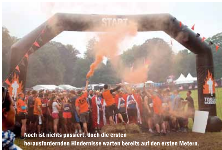
Noch ist nichts passiert, doch die ersten herausfordernden Hindernisse warten bereits auf den ersten Metern.