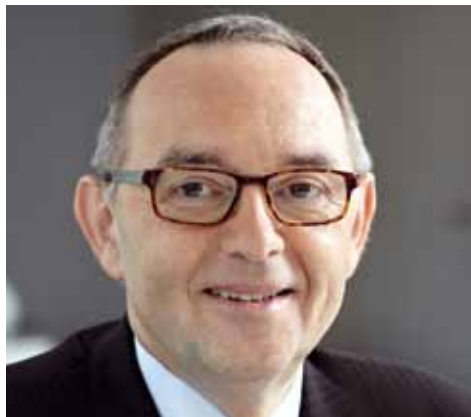
Finanzminister Dr. Walter-Borjans reagierte mit einer Haushaltssperre auf die Niederlage der Regierung vor dem Verfassungsgerichtshof.

Die Opposition fuhr angesichts der offenkundig auf ihre Niederlage vor dem Verfassungsgerichtshof nur unvollkommen vorbereiteten Landesregierung schweres Geschütz auf. FDP-Fraktionschef Christian Lindner kritisierte eine unseriöse, spekulative Finanzpolitik. Trotz sprudelnder Steuereinnahmen eine Haushaltssperre zu verhängen, sei eine „Kapitulationserklärung“. Die Regierung gebe damit ihre Gestaltungsverantwortung ab. Der CDU-Fraktionsvorsitzende Armin Laschet kritisierte die Regierung-