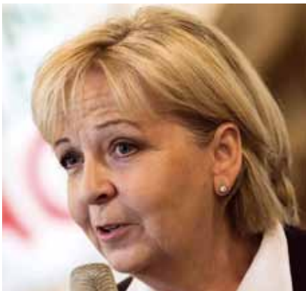
Ministerpräsidentin Hannelore Kraft (SPD) mutet vielen Beamten abermals ein weiteres Sonderopfer zu.

Die gleiche Strategie verfolgte offenbar auch Hannelore Kraft (SPD) , die im Sommerinterview mit der Westdeutschen Allgemeinen Zeitung (WAZ) nachdrücklich darauf aufmerksam machte, dass sie trotz ihrer krachenden Niederlage vor dem Verfassungsgerichtshof in Münster bei den Beamten sparen wolle. Sie erläuterte, dass die Richter „eine soziale Staffelung der Besoldung“ durchaus als vertretbar angesehen hätten. Zudem hätte das Gericht keine 1:1-Übertragung des Tarifabschlusses auf den Beamtenbereich verlangt, was dem Land Kosten von 1,3 Milliarden Euro verursacht hätte. Die-