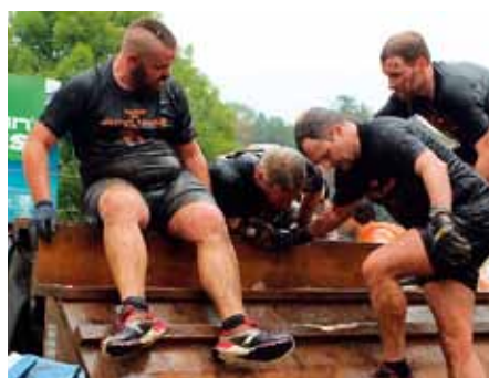
„Mist, die Kälte des Eiswassers erreicht auch noch die letzte Fettzelle!“

Die restlichen acht sahen dem Lauf mit einer Mischung aus Nervosität, Respekt, aber auch Vorfreude entgegen. Sie konnten am Tag des Ereignisses den Startschuss kaum abwarten und beobachteten ungeduldig die vor ihnen startenden Gruppen. Die insgesamt 7.500 Läufer des Wochenendes wurden in Zeitabständen von 20 Minuten auf die Strecke geschickt. Entsprechend aufgewühlt präsentierte