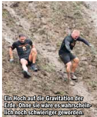
Ein Hoch auf die Gravitation der Erde. Ohne sie wäre es wahrscheinlich noch schwieriger geworden.

Bei den abwechslungsreichen Herausforderungen wurde auch deutlich, dass zur Vorbereitung auf einen solchen Extremelauf die Wahl der richtigen Kleidung von essentieller Bedeutung ist. Neben leichten, schnell trocknenden Textilien zählen vor allem robuste Handschuhe zur unverzichtbaren Grundausstattung. Spätestens ab Kilometer 10 werden die Gruppen kraftloser, die Anfeuerungsrufe lei-