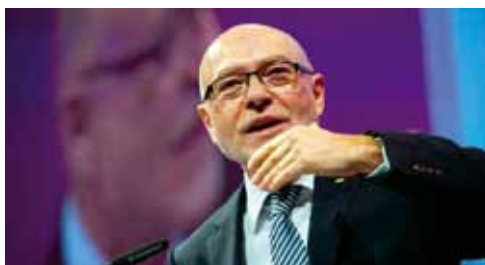
Udo Di Fabio, Ex-Verfassungsrichter.

Das von der Bundesregierung beabsichtigte Tarifeinheitgesetz wird die Hürde der Verfassungsmäßigkeit nach Ansicht des DBB nicht überspringen. Mit dieser Einschätzung steht der DBB im Übrigen nicht allein. Zwischenzeitlich hat Bundesarbeitsministerin Andrea Nahles (SPD) die Eckpunkte für ein solches Gesetz vorgelegt. Nach Kenntnisnahme von