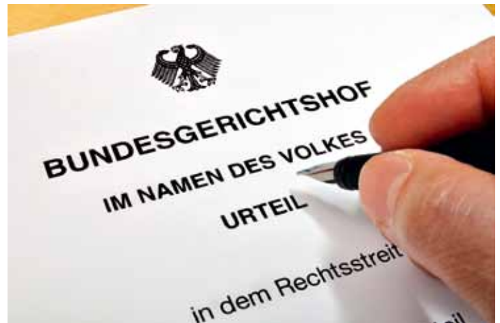
Der Bundesgerichtshof in Karlsruhe hat die Vollziehung von Abschiebehaft in normalen Vollzugseinrichtungen für unzulässig erklärt.

In einem weiteren Verfahren hat der Bundesgerichtshof zudem entschieden, dass die Anordnung von Abschiebehaft – ent-