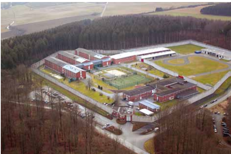
Der BSBD erwartet von der Politik eine schnelle Klärung der künftigen Nutzung der Einrichtung.

Dieses Nebeneinander der unterschiedlichen Haftarten ist nach dem Urteil des Bundesgerichtshofs in Karlsruhe so nicht mehr möglich. Der BSBD hat deshalb bereits dafür plädiert, die Einrichtung in Büren wieder ihrer ursprünglichen Bestimmung zuzuführen. Nach dem in diesem Jahr zu beobachtenden sprunghaften Anstieg der Zahl der Asylbewerber ist zu erwarten, dass auch der Bedarf an Plätzen für die Vollziehung von Abschiebe-