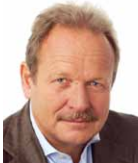
Ver.di-Chef Frank Bsirske.

In seltener Einmütigkeit haben der Deutsche Gewerkschaftsbund (DGB) und die Arbeitgebervereinigungen im letzten Jahr in einer gemeinsamen Erklärung von der Bundesregierung eine Gesetzesinitiative gefordert, die sicherstellen soll, dass in einem Betrieb nur ein Tarifvertrag Anwendung findet. Nachdem in den letzten Monaten die Konsequenzen in der Diskussion deutlicher zutage getreten sind, vertritt der DGB diese Forderung nicht mehr ganz so nachdrücklich. Ver.di-Chef Frank Bsirske ist zwischenzeitlich auf Druck seiner Gewerkschaftsbasis völlig umgeschwenkt. Er hält die Risiken zwischenzeitlich für gravierender als die Chancen.