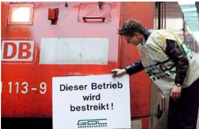
Auf Gewerkschaften wie die der Lok-Führer zielt das Tarifeinheitgesetz.

Einzel-Tarifverträge für bestimmte Berufsgruppen werden von Arbeitgebern und auch dem Deutschen Gewerkschaftsbund (DGB) kritisch gesehen. Die Arbeitgeber fürchten Daueraus-