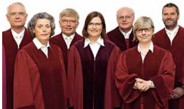
Die Richterinnen und Richter des Verfassungsgerichtshofes zu Münster haben die Verfassungswidrigkeit des Besoldungsanpassungsgesetzes festgestellt.

Damit, so Brock, hätten sich die positiven Aspekte allerdings auch schon erschöpft. Der massive Druck der Landesregierung, die dem Vernehmen nach Stellenabbau und Kürzungen bei Beihilfe und „Weihnachtsgeld“ in Aussicht ge-