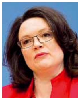
Bundesarbeitsministerin Andrea Nahles (SPD).

Speziell die laufenden Tarifkonflikte scheinen die Bundesregierung zu bestärken, das Tarifeinheitsgesetz zügig auf den Weg zu bringen. Bundesarbeitsministerin Andrea Nahles (SPD) entwickelt in dieser Hinsicht geradezu missionarischen Eifer. Dabei mag auch eine Rolle spielen, dass sie den DGB -Gewerkschaften mit dem Gesetz nebenbei auch noch unliebsame Konkurrenten aus dem Weg räumen kann. Denn eine Gewerkschaft, der von Gesetzes wegen das Streikrecht vorenthalten wird, ist ihres wichtigsten Kampfmittels und damit ihrer Durchsetzungskraft beraubt.